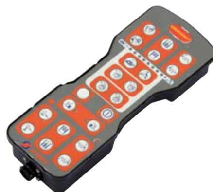
Mandos eléctricos Dina-Com2 (standard para Husky DS)

Destaques do Husky: nova fresa universal, dimensionamento baseado no critério da facilidade de manobras, e ampla gama de opcionais que versatiliza o produto.