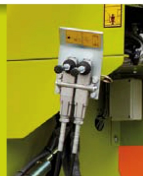
Mandos manuales con cable flexible (standard para Husky MT)

A certificação de qualidade ISO 9001:2008, emitida pela prestigiosa entidade suíça SQS, é o reconhecimento tangível da nossa Política de Qualidade.