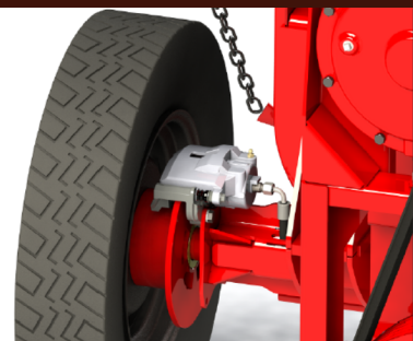
Freio a Disco