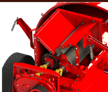
Sistema de Cracker