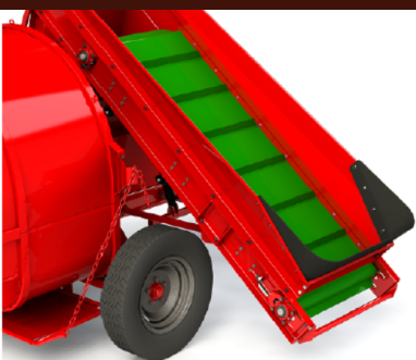
Esteira Transportadora em Borracha