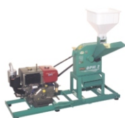
Base para motor a diesel ou gasolina