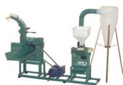
Base e prolongamento para acionar um DPM e uma Ensiladeira com o mesmo motor