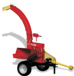
Reboque Rn01 para trator. Disponível para EN 6600, EN 6700 e EN 6800.