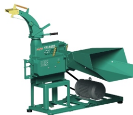
Base para motor elétrico (não incluso o motor). Disponível para EN 6400, EN 6500, EN 6600, EN 6700 e EN 6800.