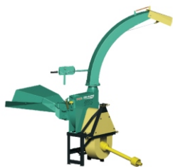
Acessório para trator, transmissão polia-polia. Disponível para EN 6600, EN 6700 e EN 6800.