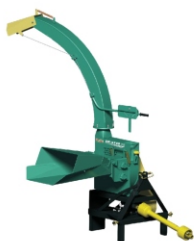
Acessório para trator com caixa de transmissão AT 90°. Disponível para EN 6600, EN 6700 e EN 6800.