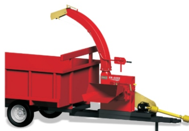
Acessório para carreta forrageira (não acompanha a carreta). Disponível para EN 6700 e EN 6800.