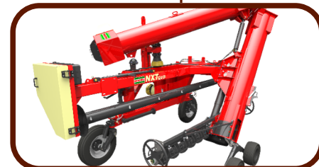
Ilustração do processo de extração dos grãos na bolsa

Fácil manuseio para o sistema de transporte