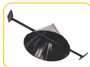
Cone Chapéu Chinês para sementes