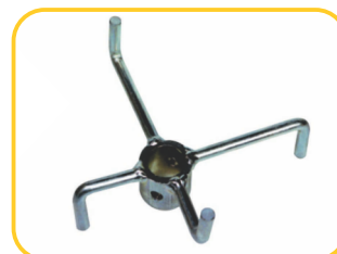
Agitador para adubos e sementes