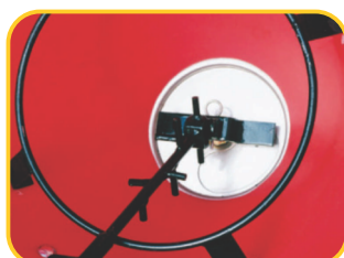
Kit especial: agitador e trilho