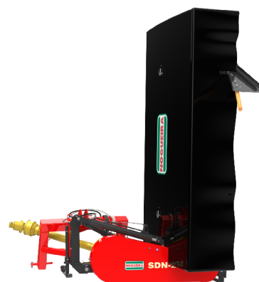
Posição de transporte com levante hidráulico