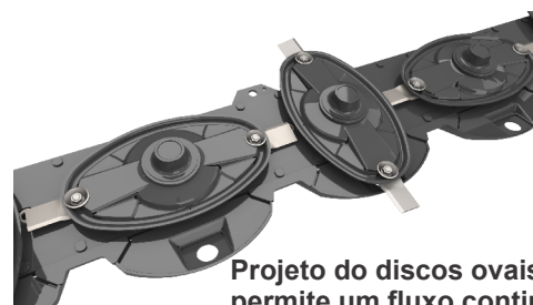
Projeto do discos ovais permite um fluxo contínuo de produtos evitando travamento dos discos, diminuindo o impacto de pequenas pedras e tornando o fluxo de trabalho suave.