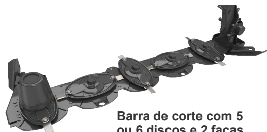
Barra de corte com 5 ou 6 discos e 2 facas por disco

Conta com cardan de giro livre que protege o sistema mecânico e um dispositivo de segurança, que protege o equipamento em eventual impacto com obstáculos, e possui também lona de proteção proporcionando maior segurança aos trabalhadores na área de corte.